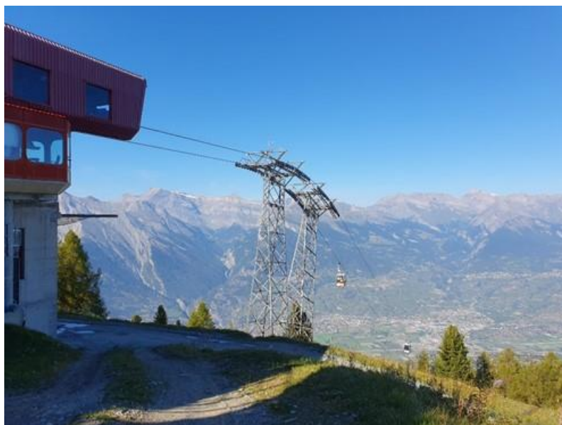
Gare d'arrivée de la télécabine de Tracouet.

Information publique, selon art. 33 al. 1 LcAT