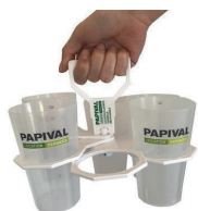
L70013 Porte verres 6x2.5dl