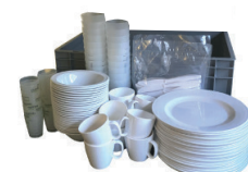
L50002 Kit Brunch 25 personnes