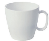
L00006 Tasse 230 ml 36 pces/caisse