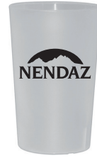
Nendaz - Verre 2.5 dl 180 pces/caisse ou 50 pces/caisse