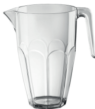
L30001 Pichet 2 L 10 pces/caisse