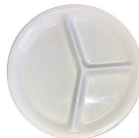
L10003 Assiette 3 comp. 50 pces/caisse