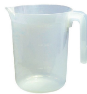
L30009 Pichet 1.4 L 50 pces/caisse