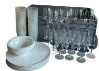
L50003 Kit Apéro 20 personnes