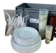
L50001 Kit Repas 10 personnes