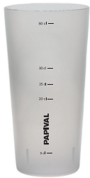
L00008 Verre 5 dl 160 pces/caisse