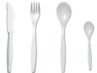
L20001 - Couteau 50 pces/sachet L20002 - Fourchette 50 pces/sachet L20003 - Cuillère à soupe 50 pces/sachet L20004 - Cuillère à café 50 pces/sachet